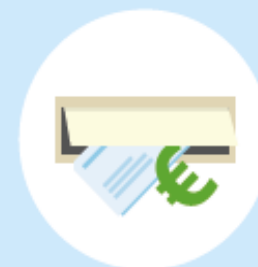
OPVOLGEN DOOR BRP-AFNEMERS