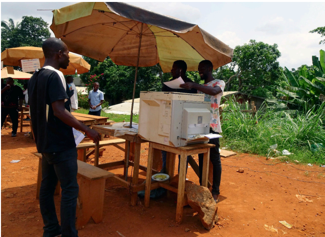
Voorbeeld van lokale afgifte

Deze lijst is niet limitatief. De positieve en negatieve elementen uit een combinatie van bovenstaande factoren worden gewogen door de documentdeskundige, waarna de hoogte van de waarschijnlijkheidsconclusie wordt bepaald.