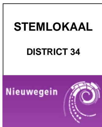
Voorbeeld formaat A1