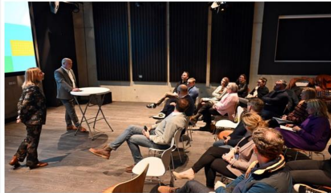
NVVB aanwezig bij bijeenkomst Gemeente Kerkrade